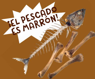
Restos de carne y pescado