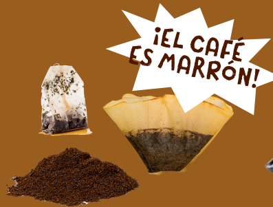
Posos de café e infusiones