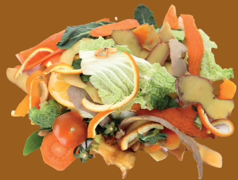
Restos de fruta y verdura

¿QUÉ RESIDUOS SE PUEDEN DEPOSITAR EN EL CONTENEDOR MARRÓN?