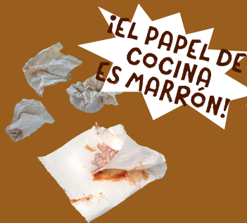
Papel de cocina y pañuelos de papel