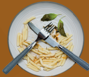
Restos de comida cocinada