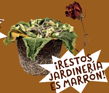
Restos de jardinería