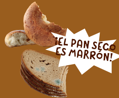
Pan y alimentos caducados