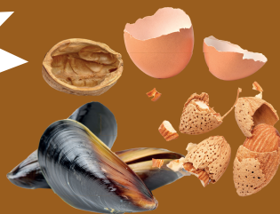
Cáscaras de huevo, frutos secos y marisco